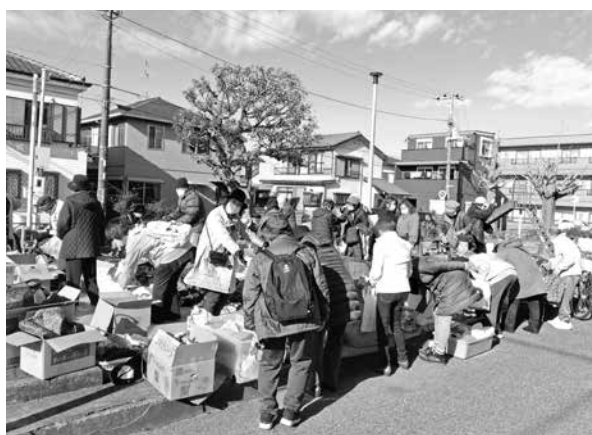
バザーには多くの人が参加