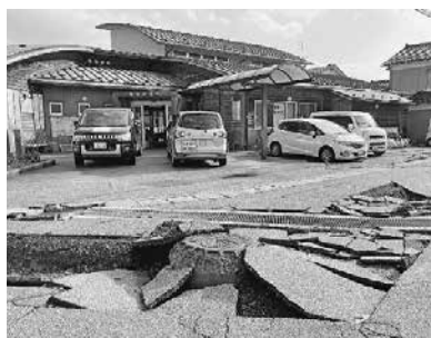
地震で崩れた輪島診療所前の道路

写真を見ても分かるように、道路の陥没、亀裂などの被害は過去の地震のニュースではあまり見なかった光景のような気がします。